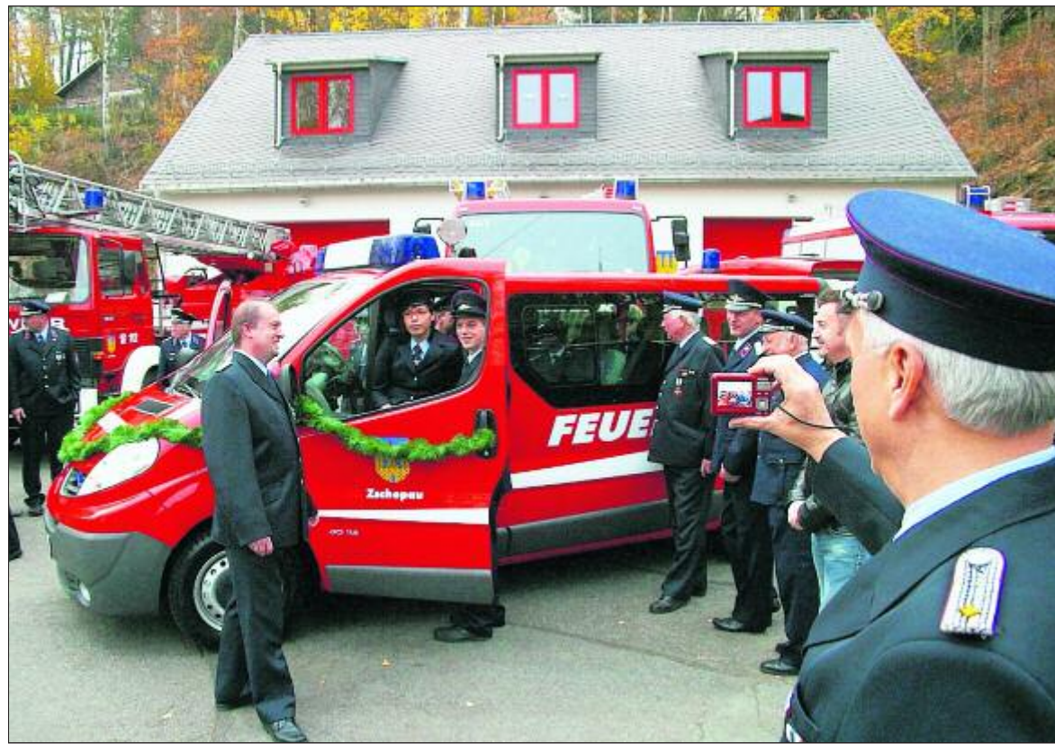
Bei der Übergabe des Mannschaftstransportwagens an die Freiwillige Feuerwehr Zschopau waren die Kameraden am Samstag in bester Feierlaune.

Neben nur gelegentlichen Wolkenlücken ist es überwiegend wolkenverhangen, nur vereinzelt gibt es Sprühen.